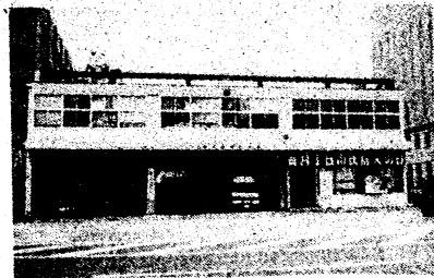
新年度で消防本部庁舎の基本構想を策定する