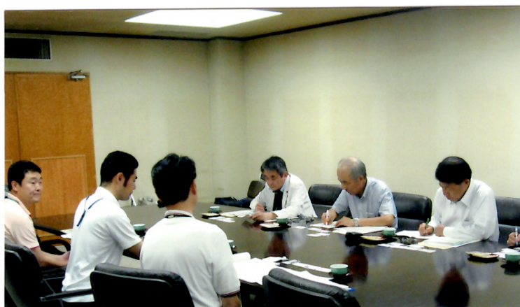
前橋市役所で電力料金削減効果の説明をうける議員団(右席)

無所属クラブは、7月19日群馬県前橋市に新電力事業者からの電力購入状況の視察をさせて頂きました。標記は平成28年度と新電力導入前の平成24年度の消費電力の比較です。全体1億4600万円以上の削減効果です。市役所庁舎等だけでも、約850万円・18%の削減効果をお聞きすることが出来ました。(裏面に表)